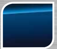
Galaxy Blue Silica

TRD hanya tersedia dengan warna Satin White Pearl, Crystal Black Silica, Orange ME & Lightning Red.