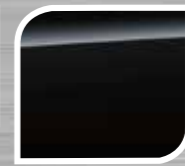
Crystal Black Silica