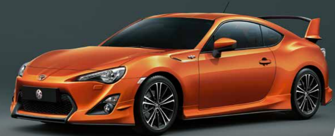
Tampilan bumper dengan lips, side skirt, dan spoiler belakang yang besar, memperkuat konsep aerodinamis dari 86 Aero.

Tanda kemenangan hari Anda dimulai saat deru nafas mesin Boxer FA20 dihidupkan. Kemampuannya yang luar biasa serta bobot mesin yang seimbang tetap menjuarai kenikmatan serunya berkendara bagi semua kalangan.