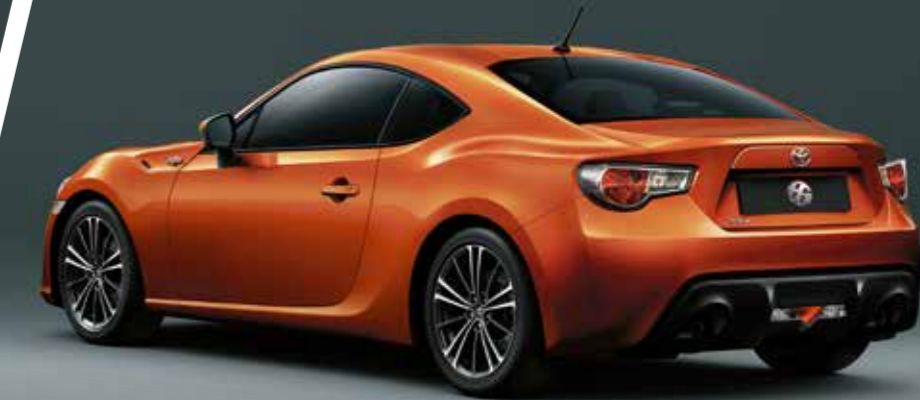
Tampilan minimalis dan tersedianya pilihan antara 6-speed M/T dan A/T ditujukan untuk memaksimalkan kepuasan para pengendaranya.